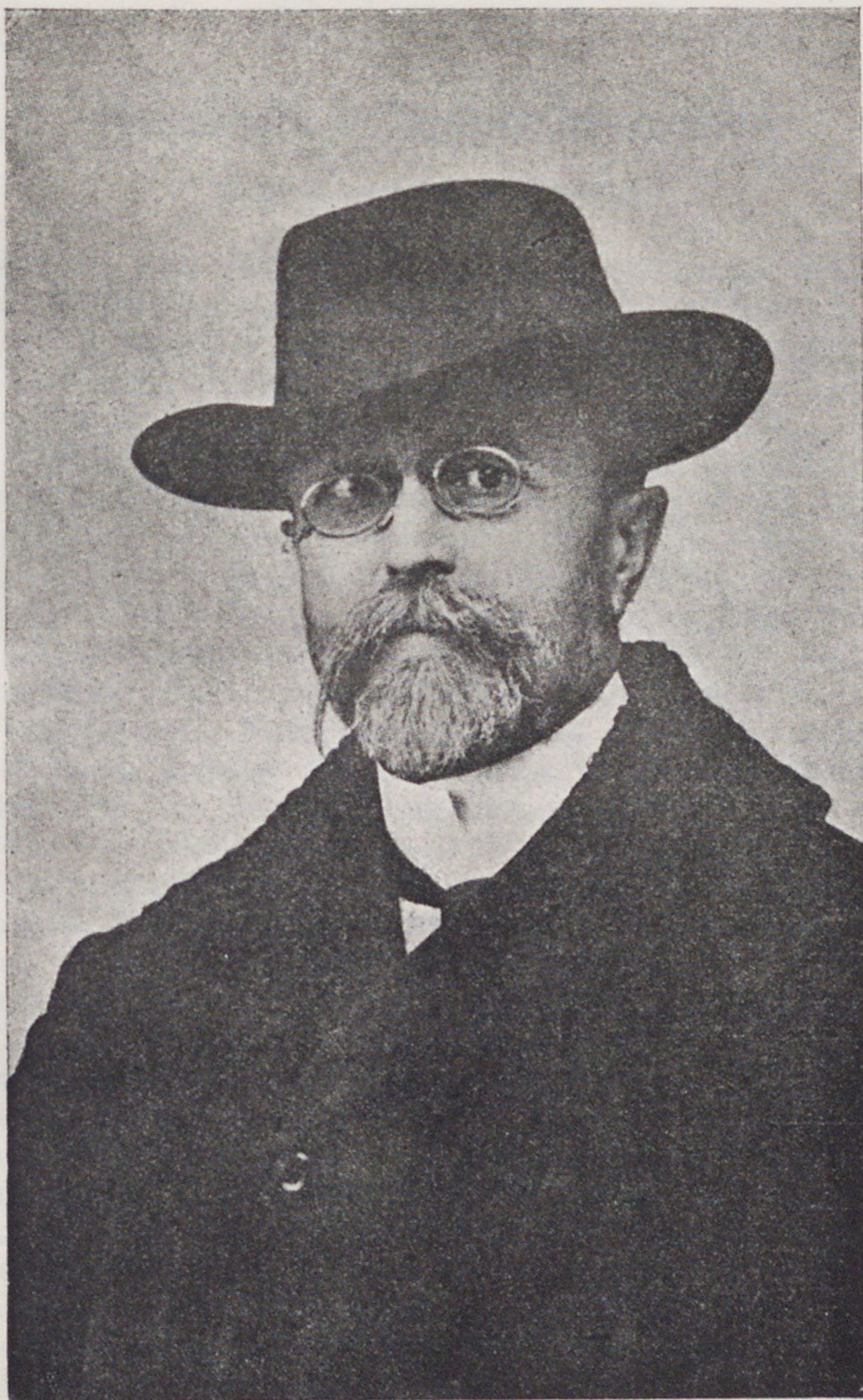
TOMÁŠ G. MASARYK.

Dal národu svobodu a národ mu dal lásku.